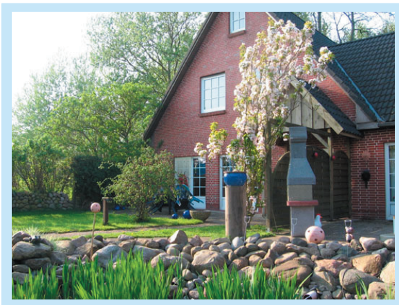
Gartenteich mit Terrasse